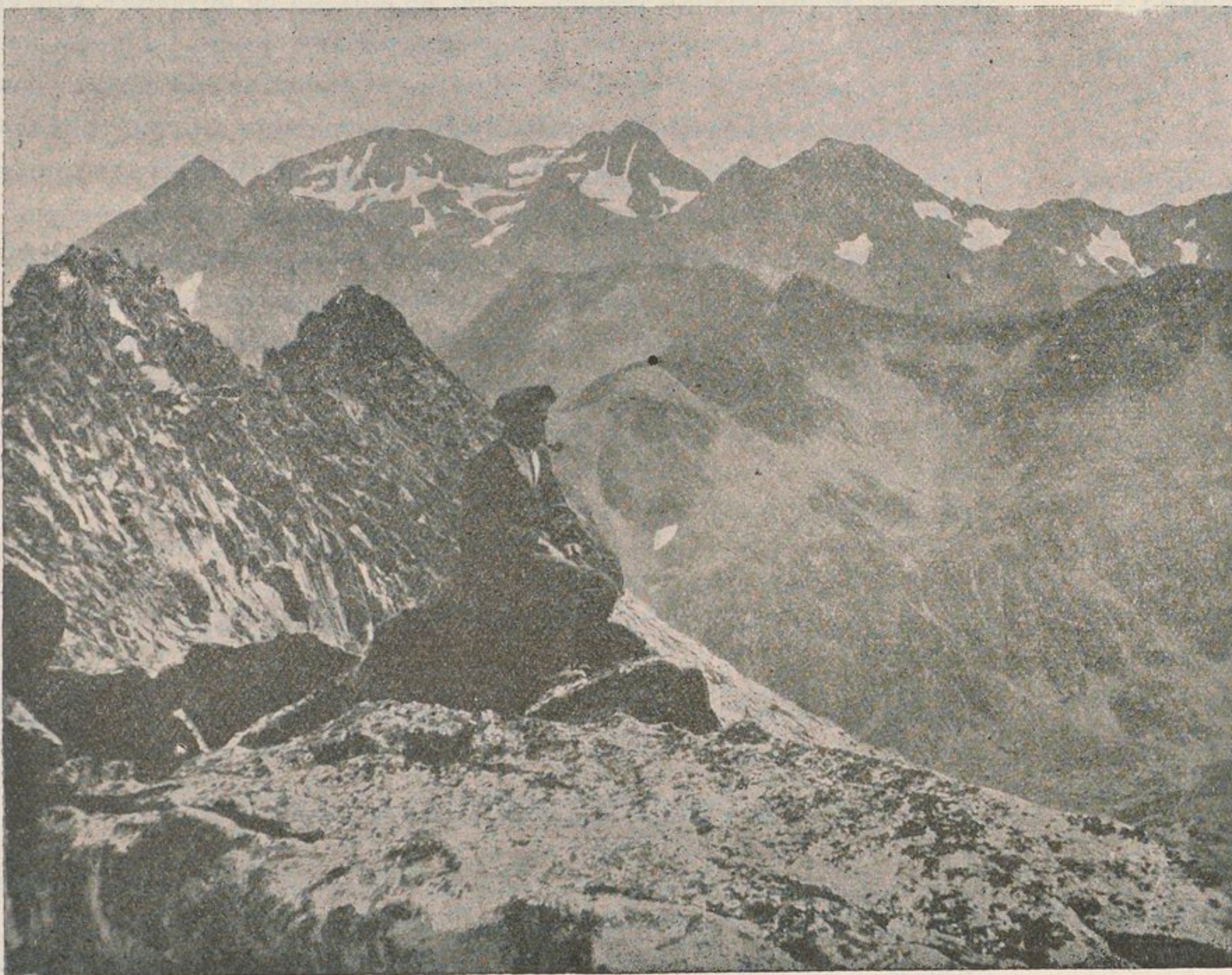
MASSIF ESTATS (3141 m ) — MONTCALM (3080 m ), du pic de Puntussan (2715 m ).

Le 25 juillet 1881, Gourdon est à Vicdessos. Il cherche un guide pour le Montcalm, et il n'est pas content des montagnards d'Auzat et de Vicdes-