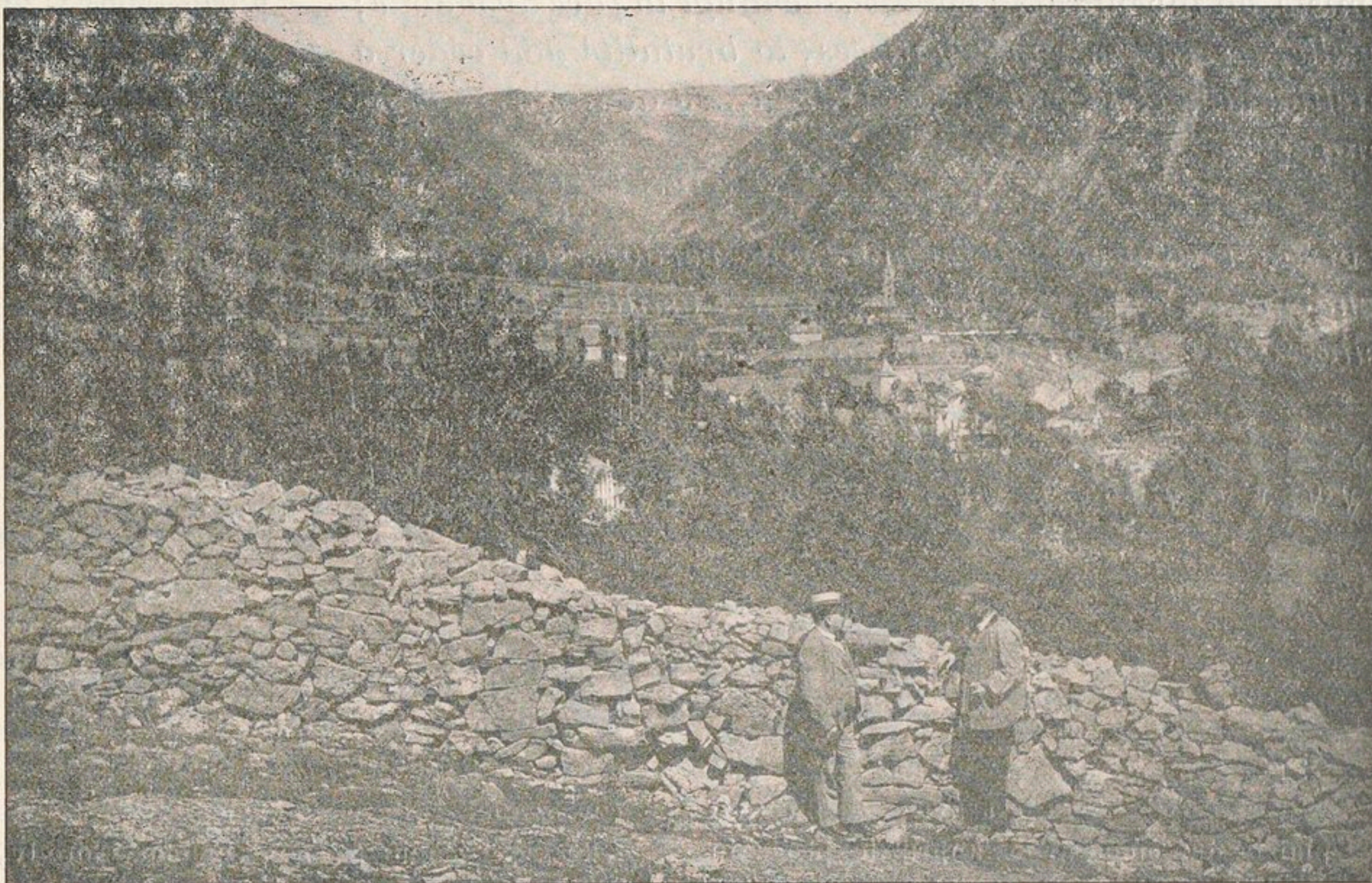
VICDESSOS — Vue générale Est.

En 2 heures, on est descendu de 1500 mètres. Ce chemin est la route de